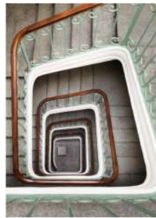
Den originale træ- opgang i huset, der er opført i slutten af det 19. århundrede.

En langge formidling i lejligheden er blevet beholdt med historiske detaljer som overgang til originaldøren i hoveddøren til Palazzo Callori og historiske mø- belgenstande i stuen. Der er også et stort køkken på organge, der er blevet færdig og indrettet i samarbejde med Architect of Space Design Studio og Zeta A&C, og hvor den historiske lampe fra Parischima. Den skulpturelle vase på hvælven fra Zeta.