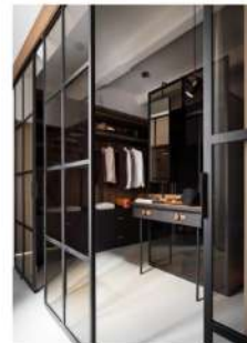
Garderoben i Fofite er del af soveværellet er specialdesignet af Fabio Fantolino. Lyskilder er fra Le Klunt og Ocbius